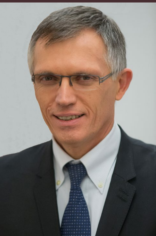
Carlos Tavares, Président du Directoire de PSA Peugeot Citroën