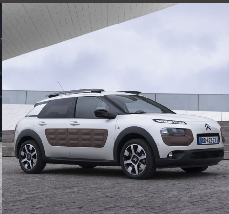
CITROËN C4 CACTUS Plus de 90 000 ventes depuis son lancement il y a 1 an - 35 distinctions reçues à travers le monde