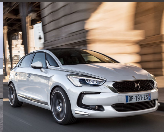
DS 5 Poursuite du développement de DS, marque premium, avec le lancement de la nouvelle DS 5