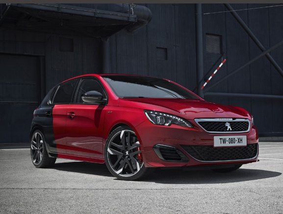
PEUGEOT 308 Succès mondial n°1 des ventes de la Marque