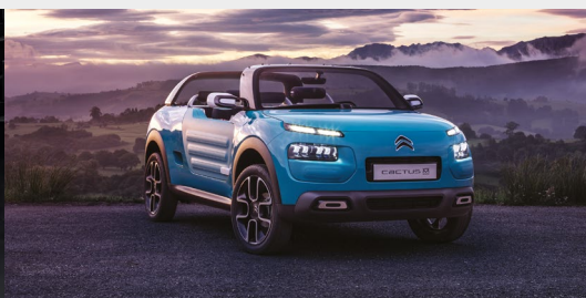
Concept C4 CACTUS M