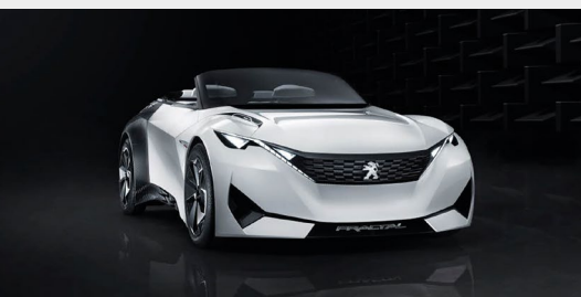
Concept-car PEUGEOT FRACTAL