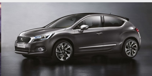
NOUVELLE DS 4