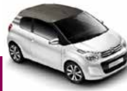
Nouvelle Citröen C1