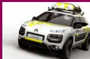
Citröen C4 CACTUS