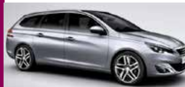
Peugeot 308 SW