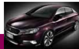
DS5 LS : Premières commandes en Chine