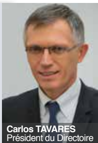
Carlos TAVARES Président du Directoire

Depuis le 31 mars 2014, M. Carlos TAVARES est Président du Directoire, date à laquelle il a succédé à Philippe VARIN à la Présidence du Directoire de PSA Peugeot Citroën.