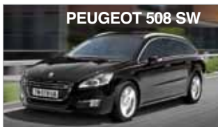
PEUGEOT 508 SW